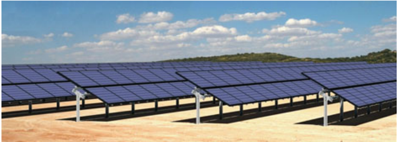
VISTA EN PERSPECTIVA DEL SISTEMA FOTOVOLTAICO.

Estructura monoposte para instalación por hincado directo de los postes sobre el terreno, concebida para alojar dos filas de paneles estándar, colocados en posición horizontal.