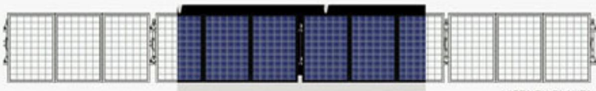
VISTA EN PLANTA.