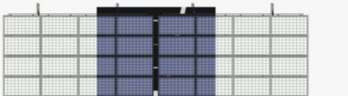
VISTA EN PLANTA.