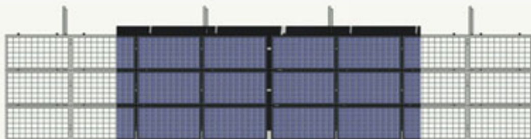
VISTA EN PLANTA.