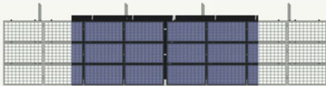
VISTA EN PLANTA.